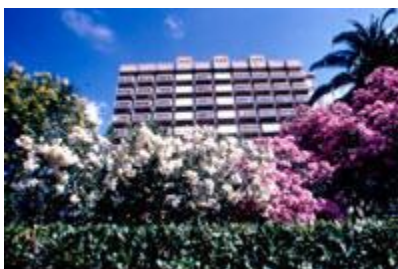
Objekat Faza 1