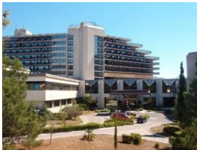
Objekat Faza 2