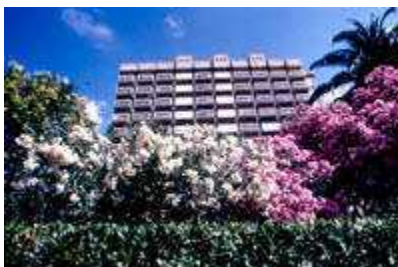
Objekat Faza 1