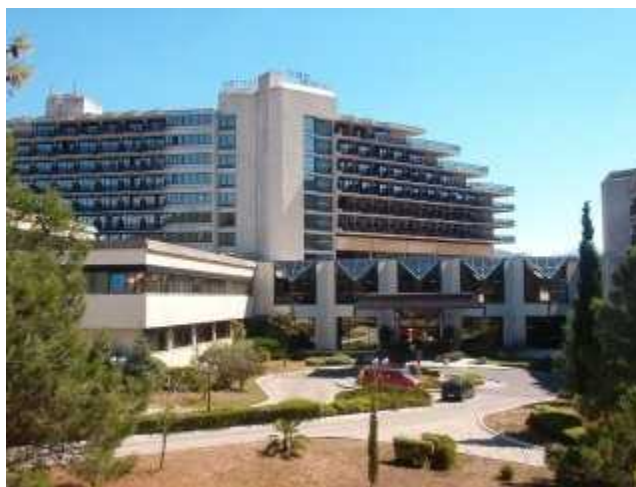
Objekat Faza 2